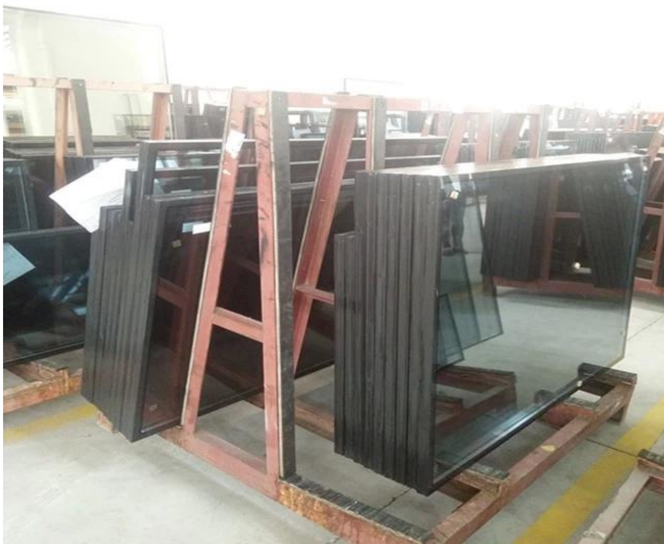
Hình ảnh bức tường kính cách điện chất lượng tốt