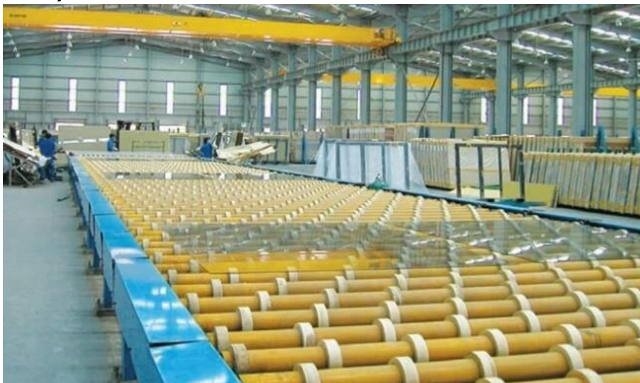
Float bao bì thủy tinh