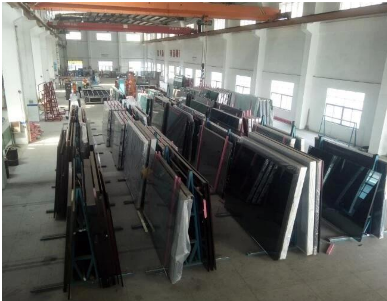
Bao bì bằng JIMY GLASS bằng thủy tinh