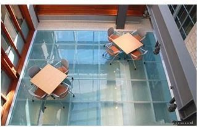
An toàn tầng kính nhà máy máy: