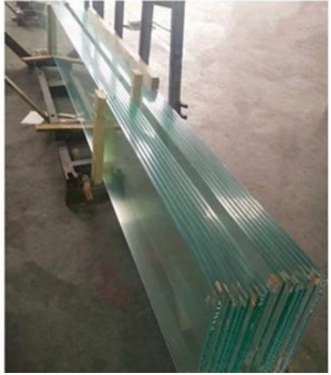
Trung Quốc nhà máy kính vôi tường