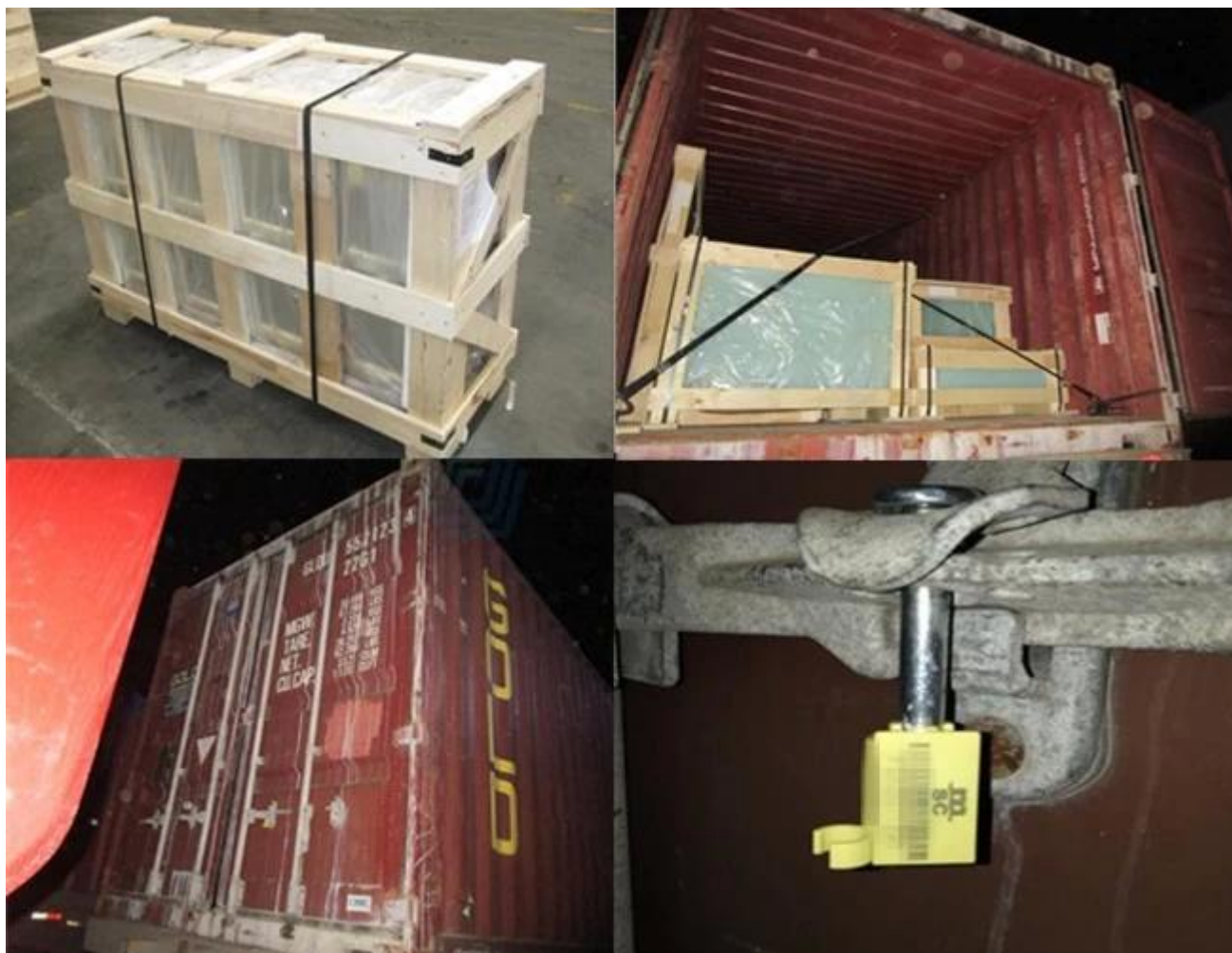
Ứng dụng của kính cường lực cao 8mm