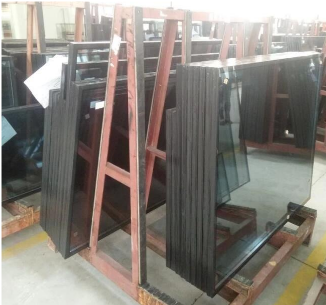
Dây chuyền sản xuất kính cách điện