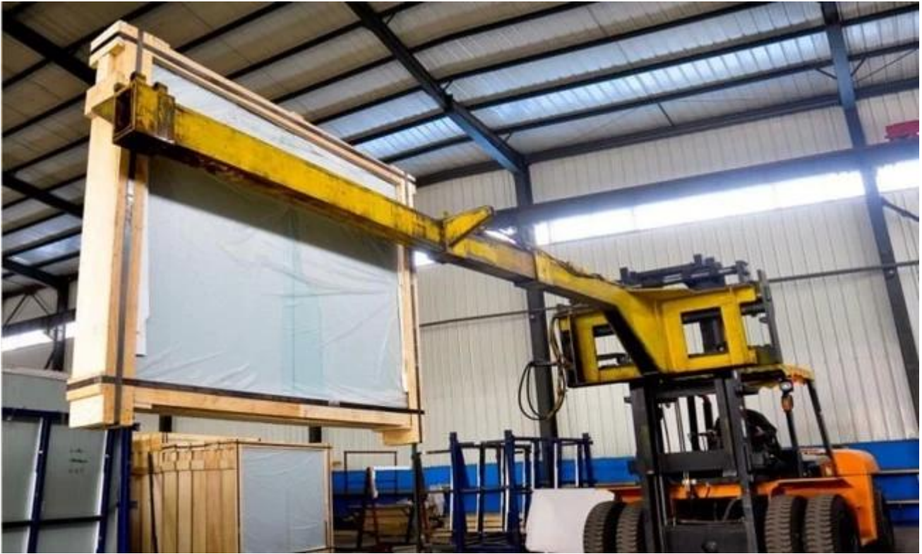
Kính an toàn tải