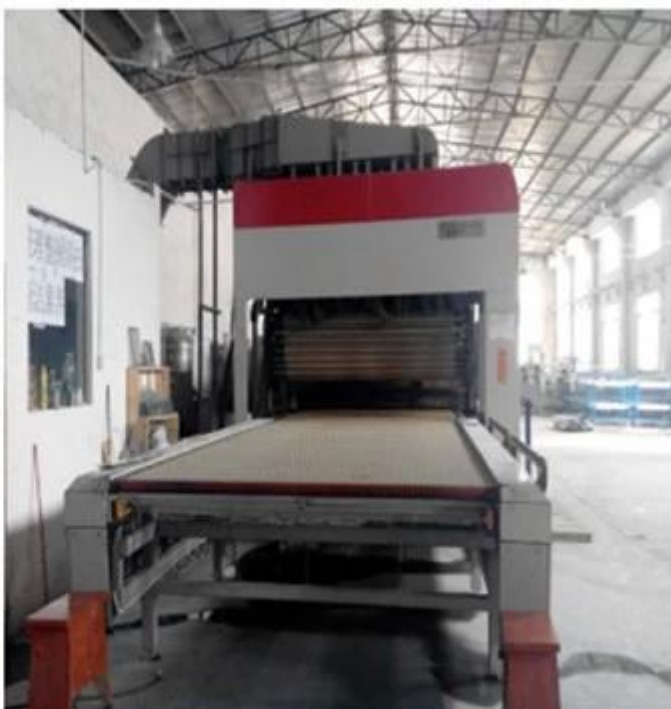
Tempered nhiều lớp kính mạnh hơn bao bì và tải