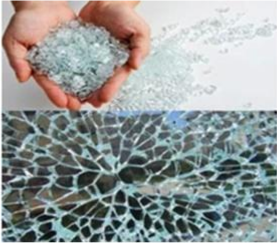
Toughened Glass broken into alveolate granules is human harmless