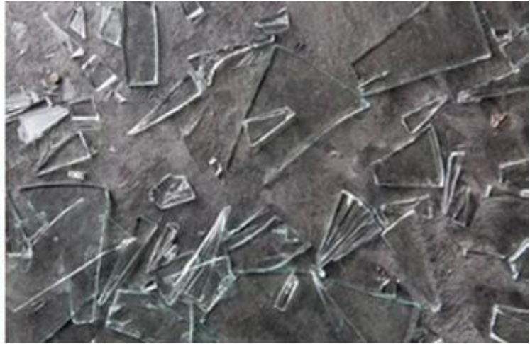
Annealed Glass when broken into sharp, easy to hurt human