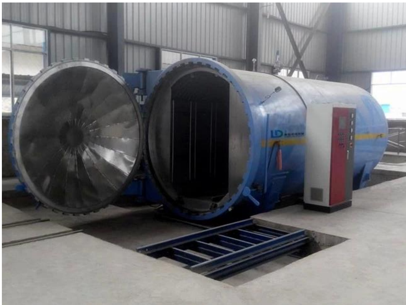
Kính thủy tinh nhiều lớp, triplex an toàn đóng gói