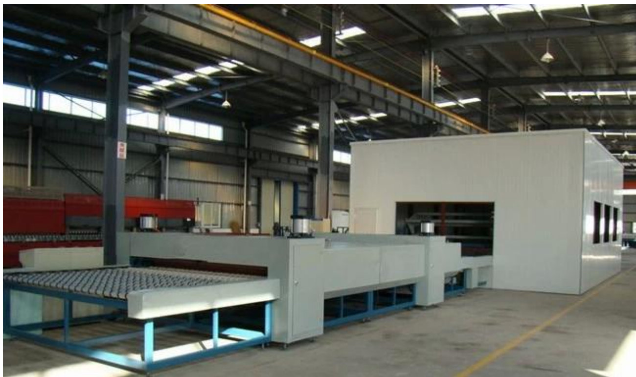
Kính nhiều lớp nổi hấp