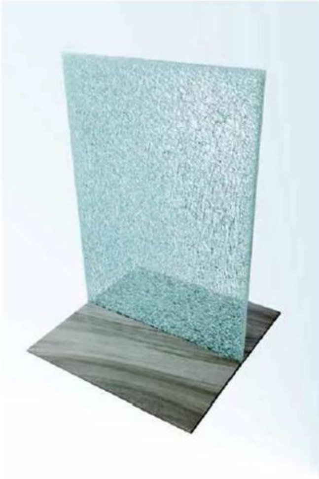
Laminated Glass with SGP Interlayer