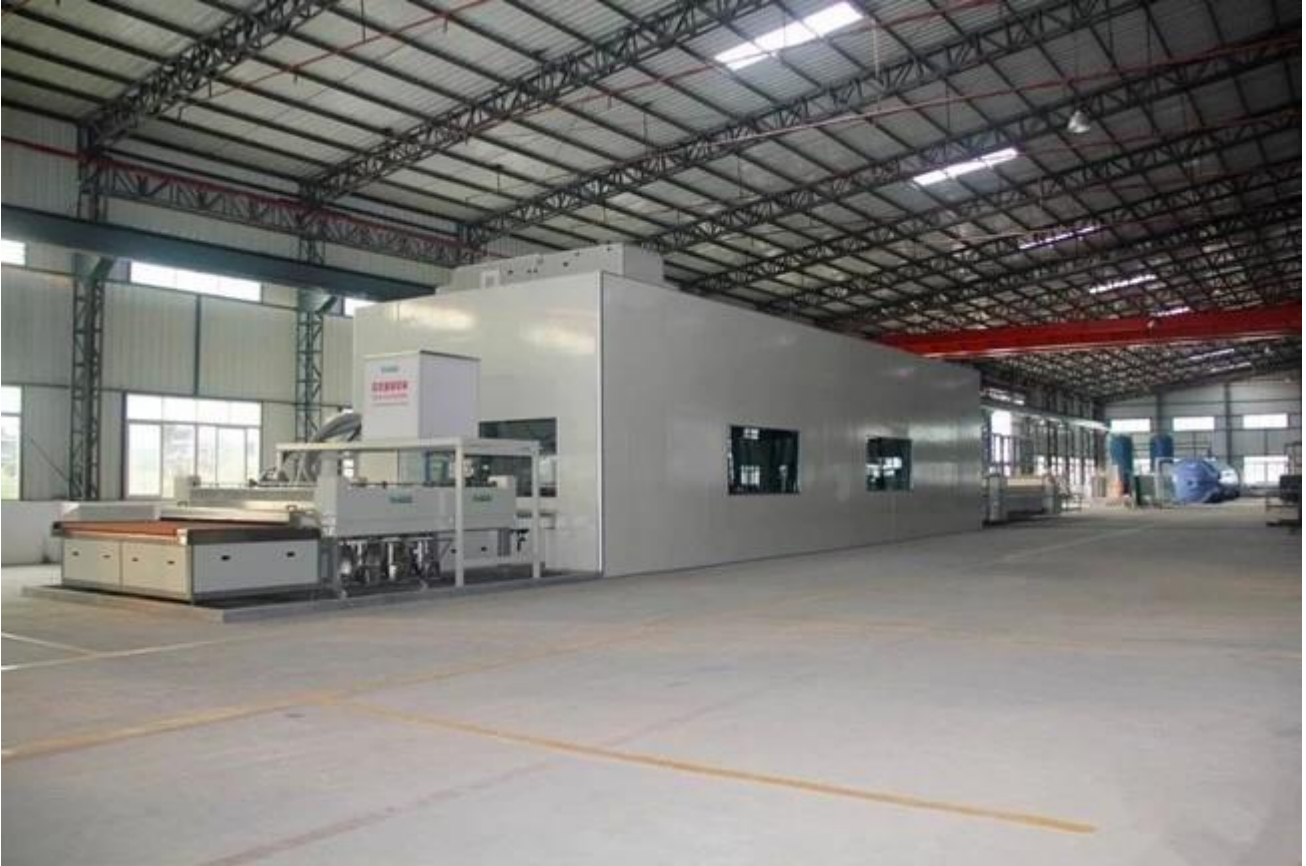
Lamine cam Emanet ambalaj