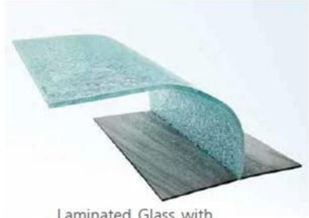
Laminated Glass with PVB Interlayer