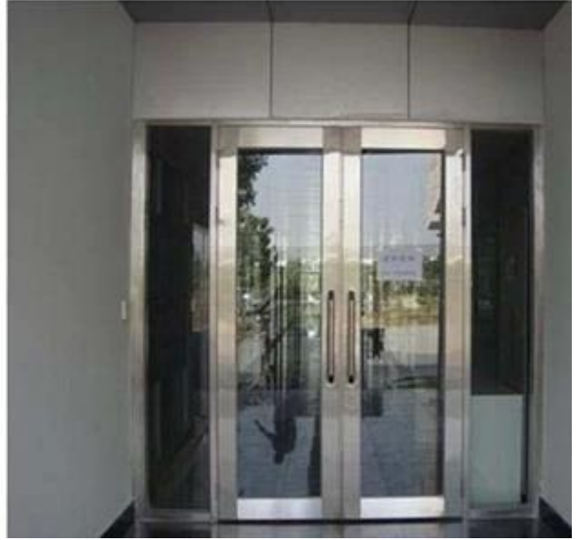
Bina bölmelerinde kullanılan yangına dayanıklı cam yalıtım