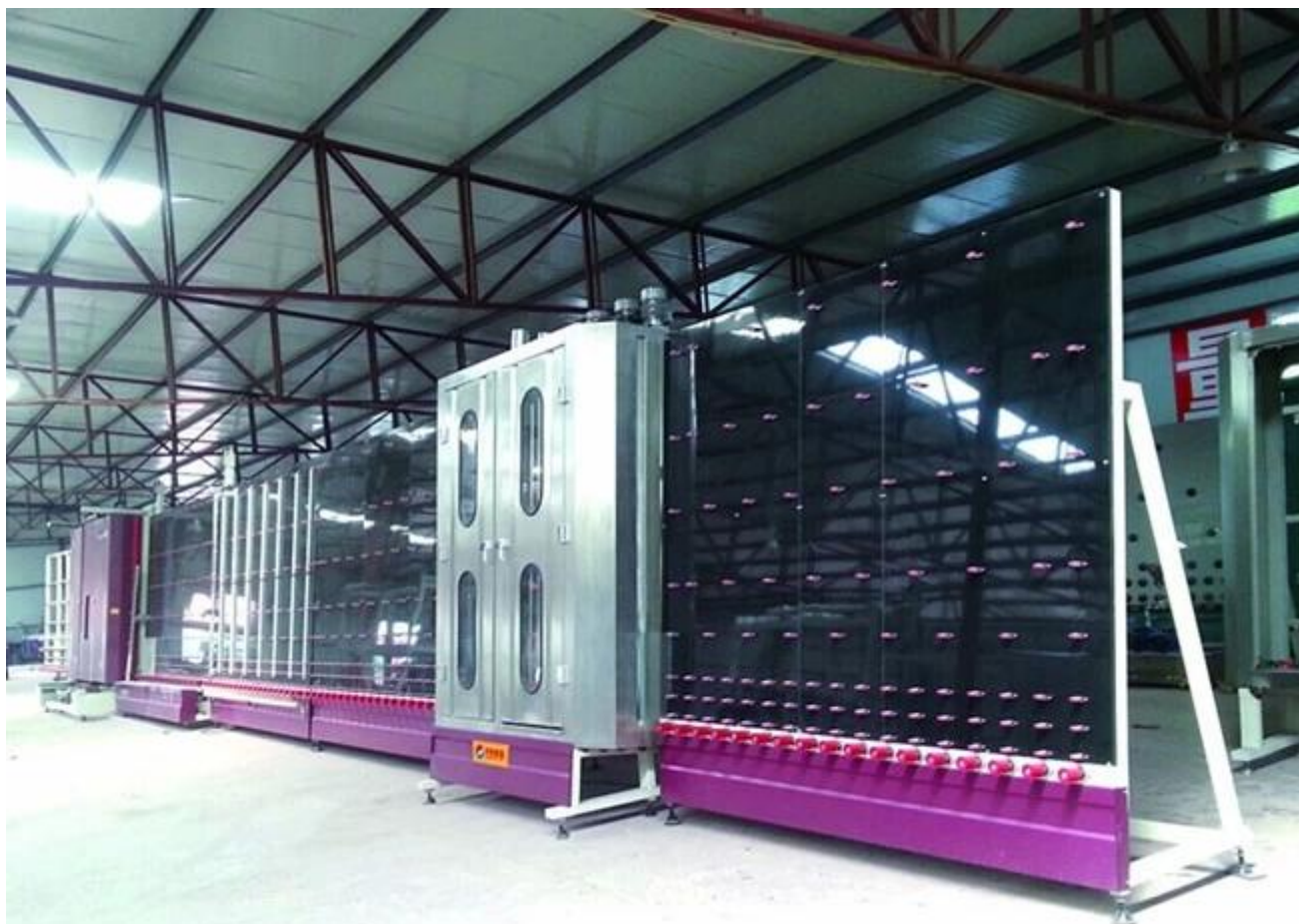
Carregamento de segurança de vidro isolado: