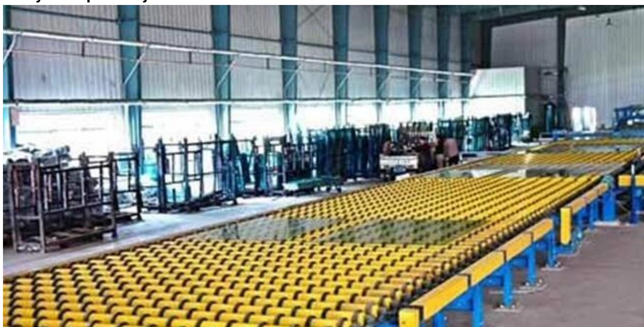
Na powierzchnię nalej opakowań szklanych i magazyn: