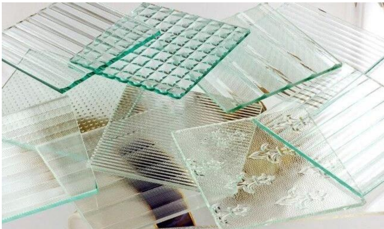
4mm Diamond jasne wzorzyste szkło: