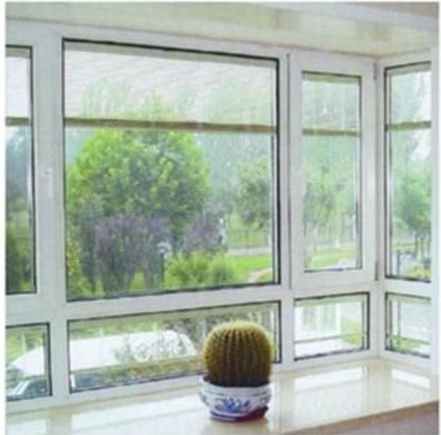
Hurtownia szkła hartowanego i maszyny.