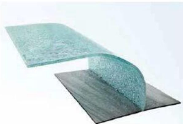
Laminated Glass with PVB Interlayer