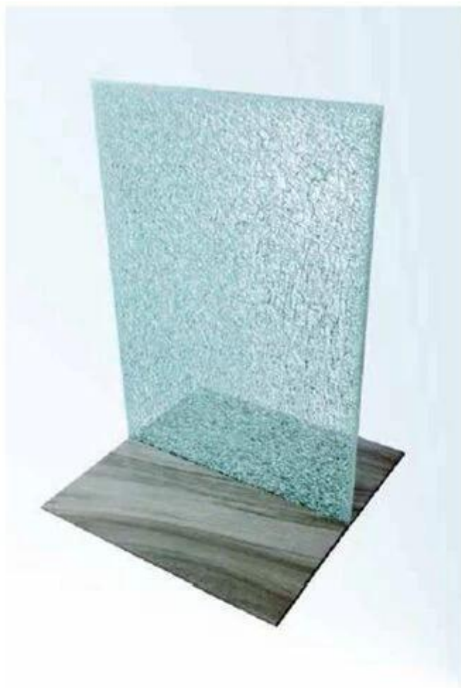
Laminated Glass with SGP Interlayer