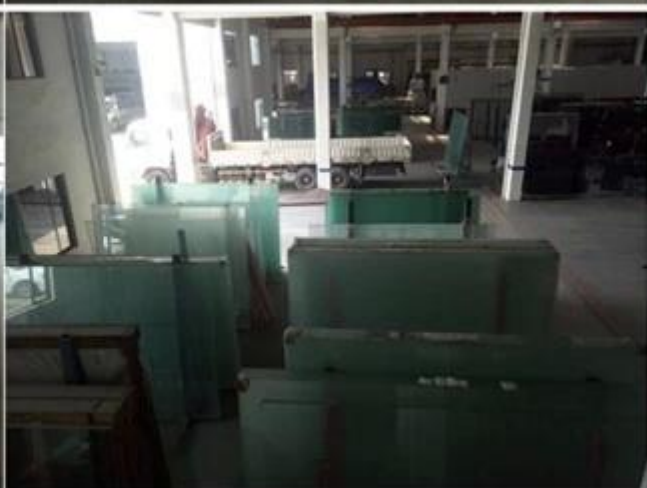
JIMY szkła bezpieczeństwa pakowane i załadunku