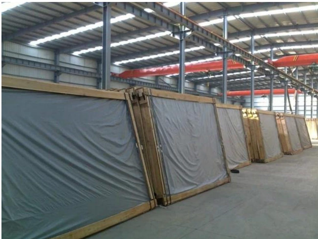
Szkło laminowane maszyny