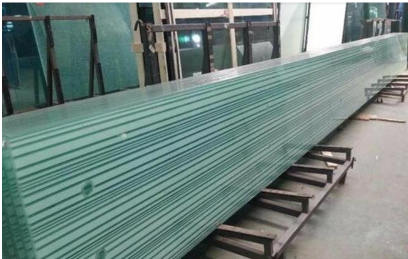
6 + 6mm Nieprzezroczyste szkło sitodrukowe w kolorze zielonego kwadratu stosowane do balustrady