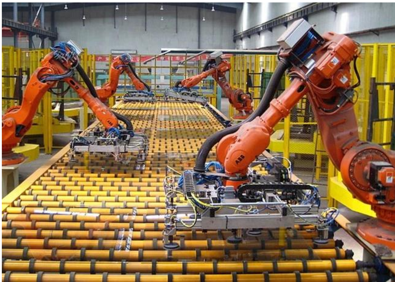
Niskie żelazo Float Glass magazynu