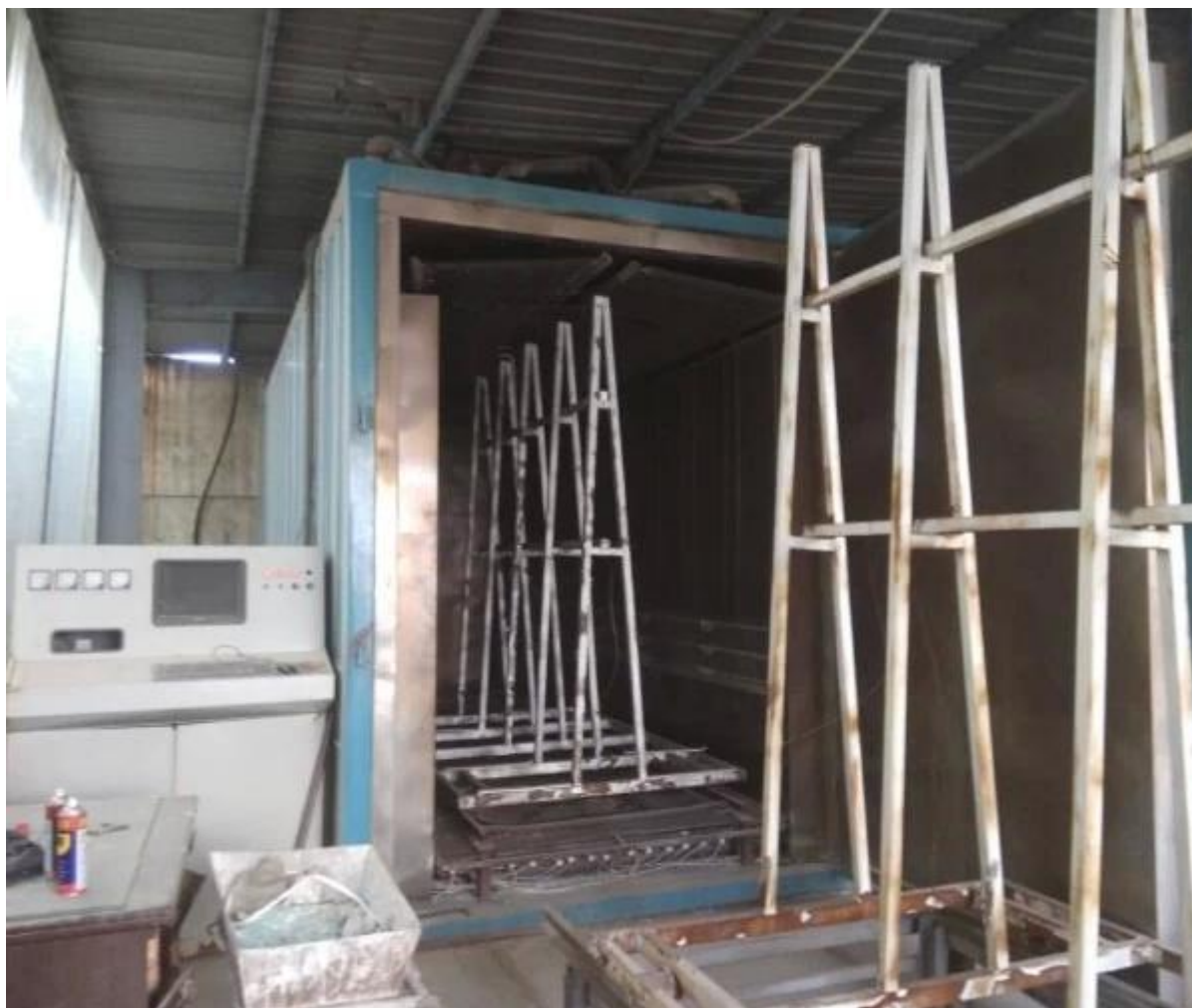
Wysokiej jakości, hartowane szkło hartowane