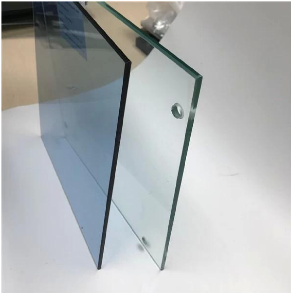
Ultra jasne hartowane ciepło nasączone szkłem