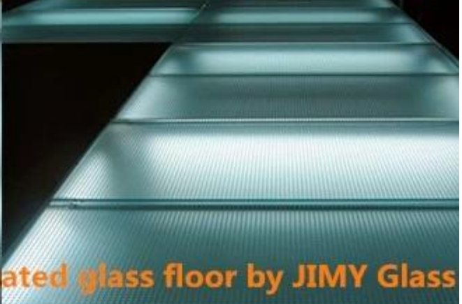
Anti-skid laminated glass floor by JIMY Glass