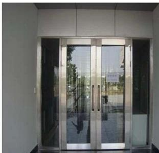
Verre isolant ignifuge utilisé pour la cloison de bâtiments