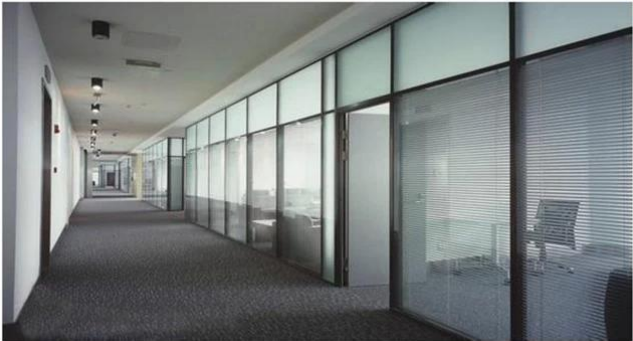
Fabricant de verre isolant-ignifuge