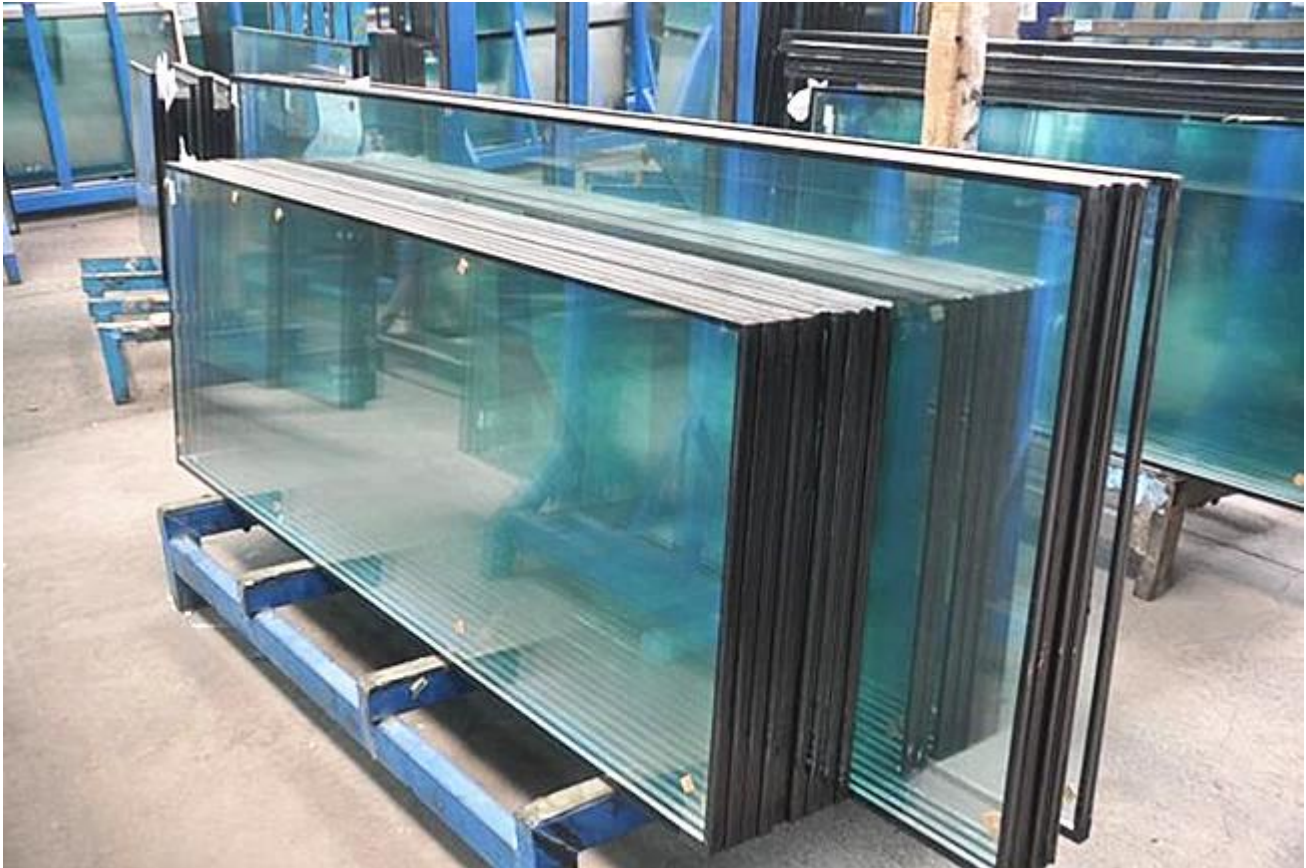
Verhotseinällä käytettävä karkaistu laminoitu eristetty lasi: