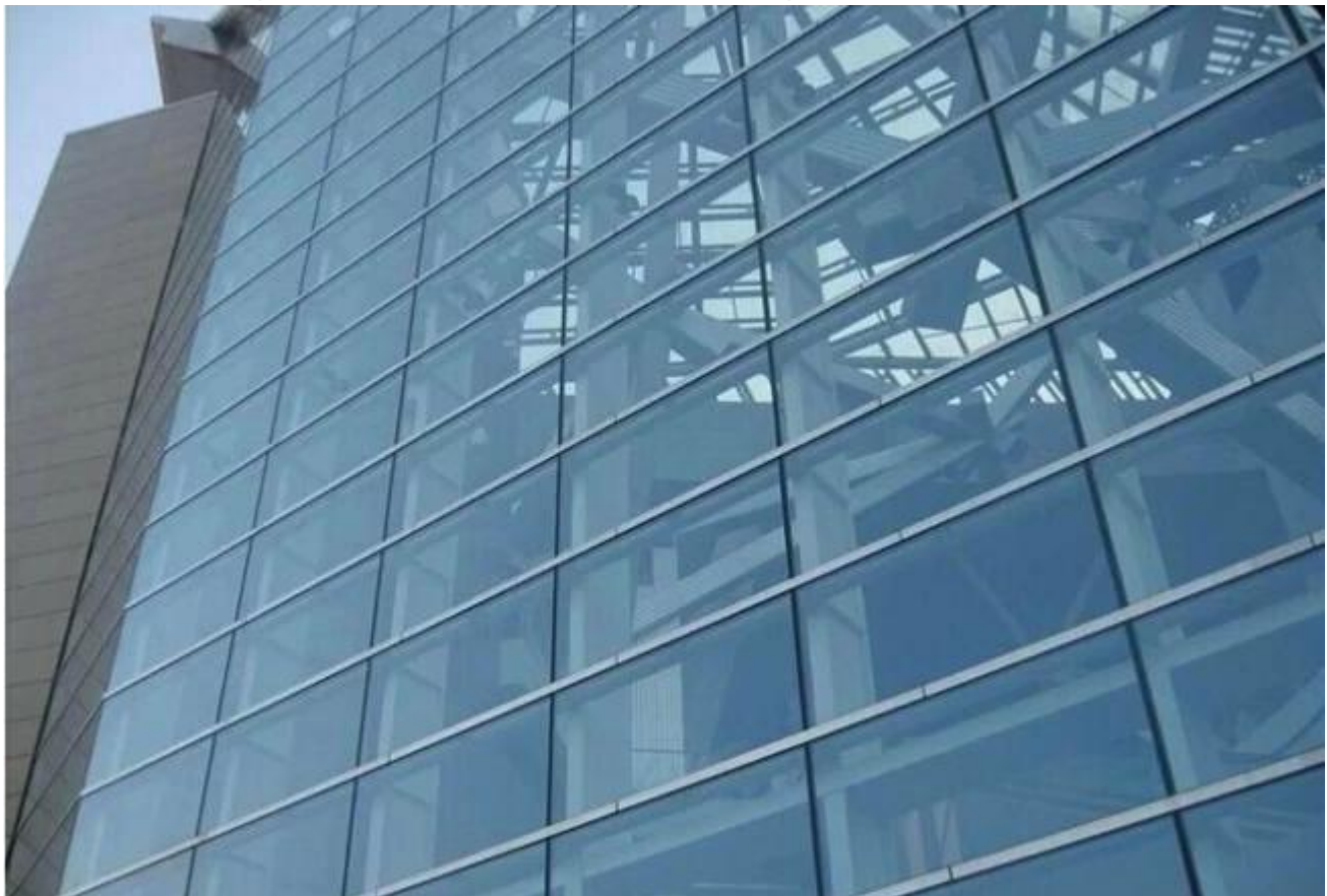
JIMY glass eristetty lasivarasto: