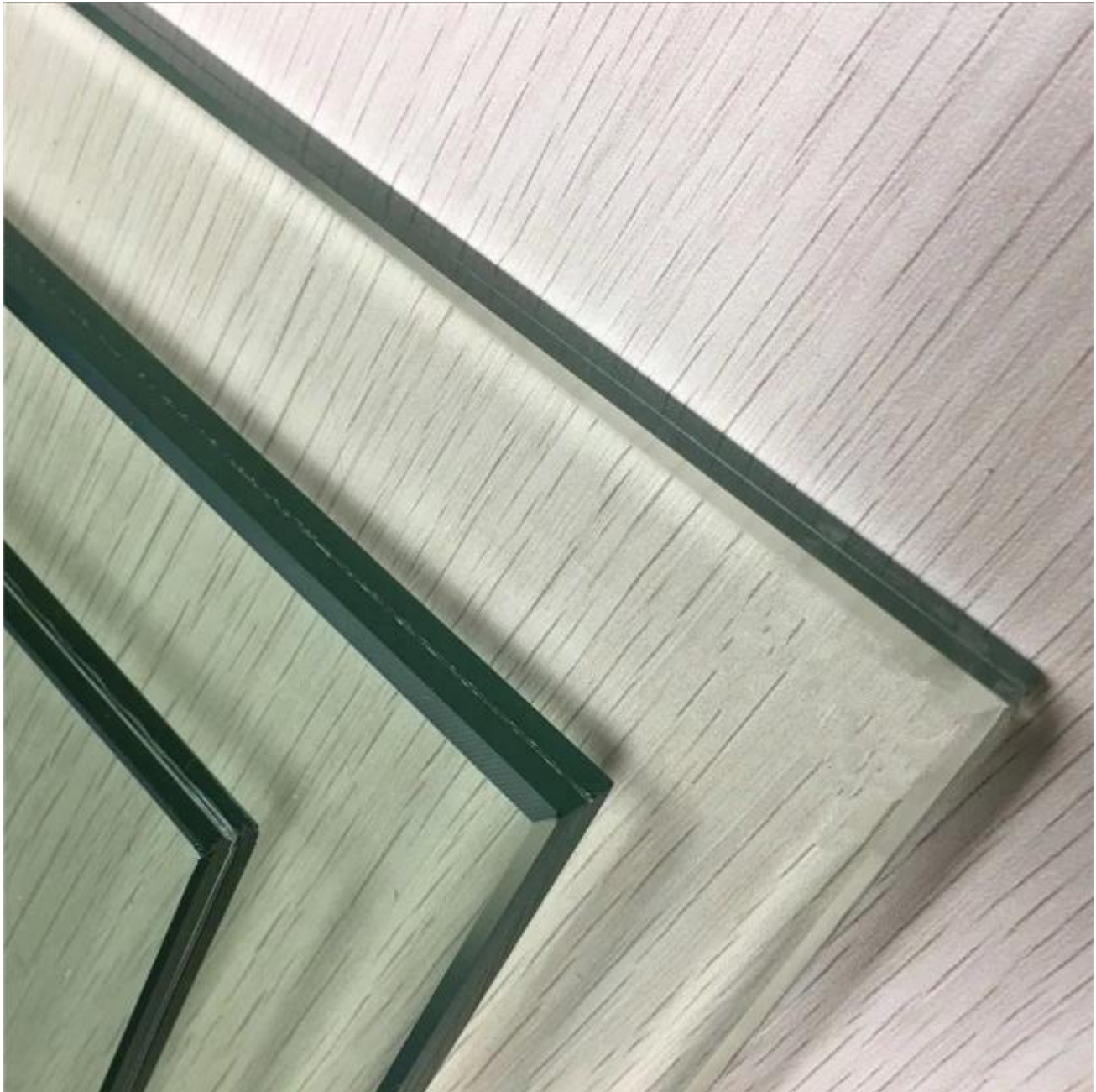
Turvalasin kanssa leikkauksia ja reikiä