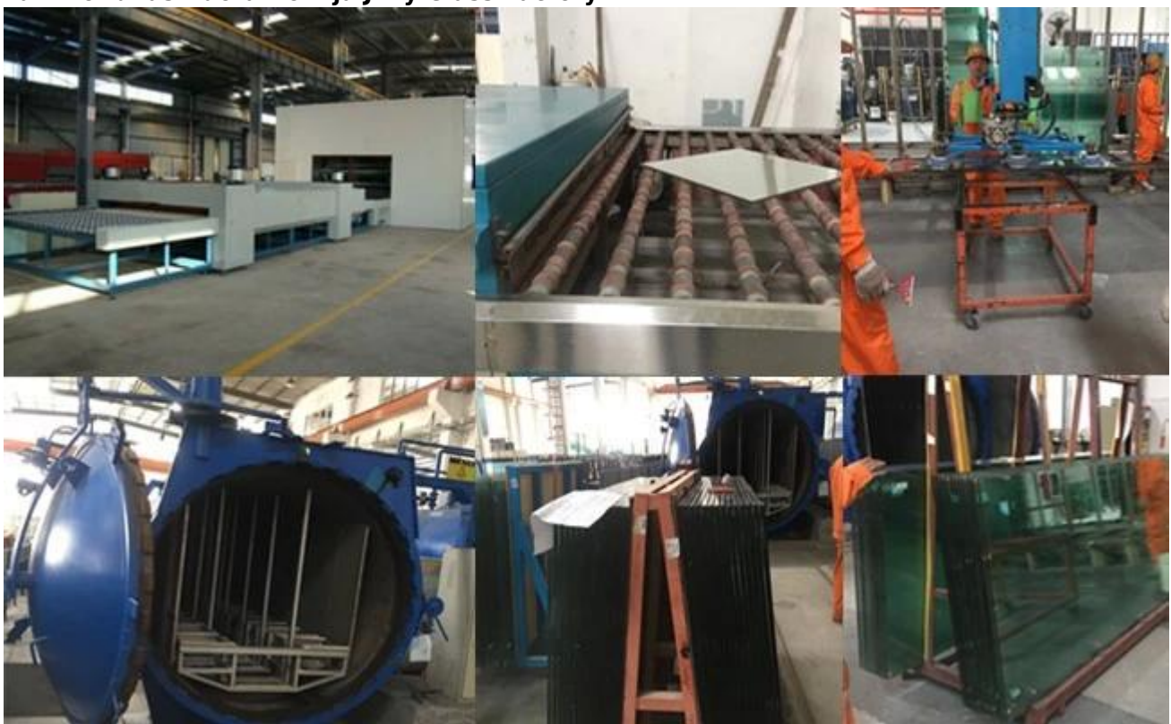
Soveltuvat 15 + 15 mm laminoitunuturvalasit