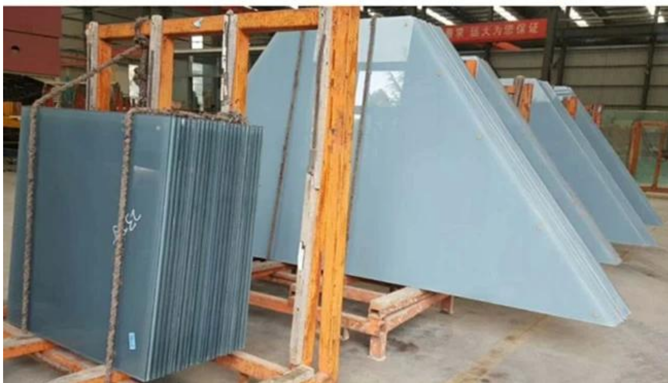
Forma especial gris blanco estructura de vidrio laminado templado laminado proyecto: