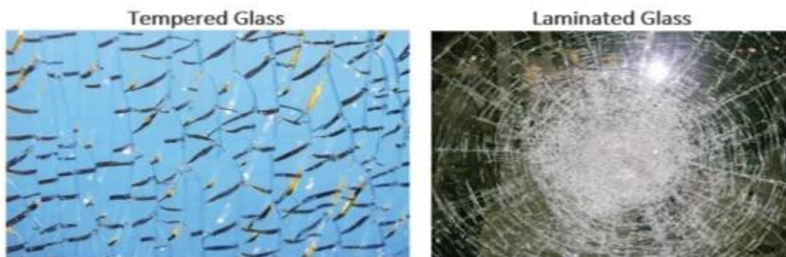
Laminated Glass Layers

El vidrio laminado es básicamente un sándwich de vidrio. Está hecho de dos o más capas de vidrio con una capa intermedia de vinilo (PVB SGP, EVA) entre (emparedado, por así decirlo, como en el parabrisas de un automóvil). El vidrio tenderá a permanecer unido y la caja se rompe, lo que califica como material de acristalamiento de seguridad.