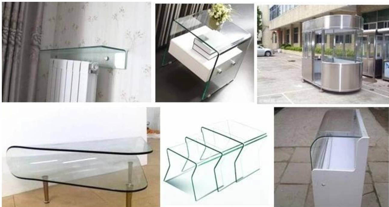
Fábrica de vidrio doblado y carga de seguridad