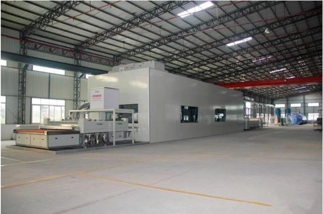
Lamelliertes Glas Sicherheitsverpackung