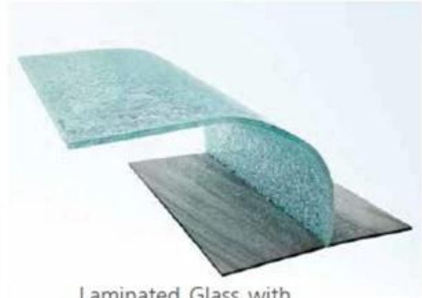
Laminated Glass with PVB Interlayer