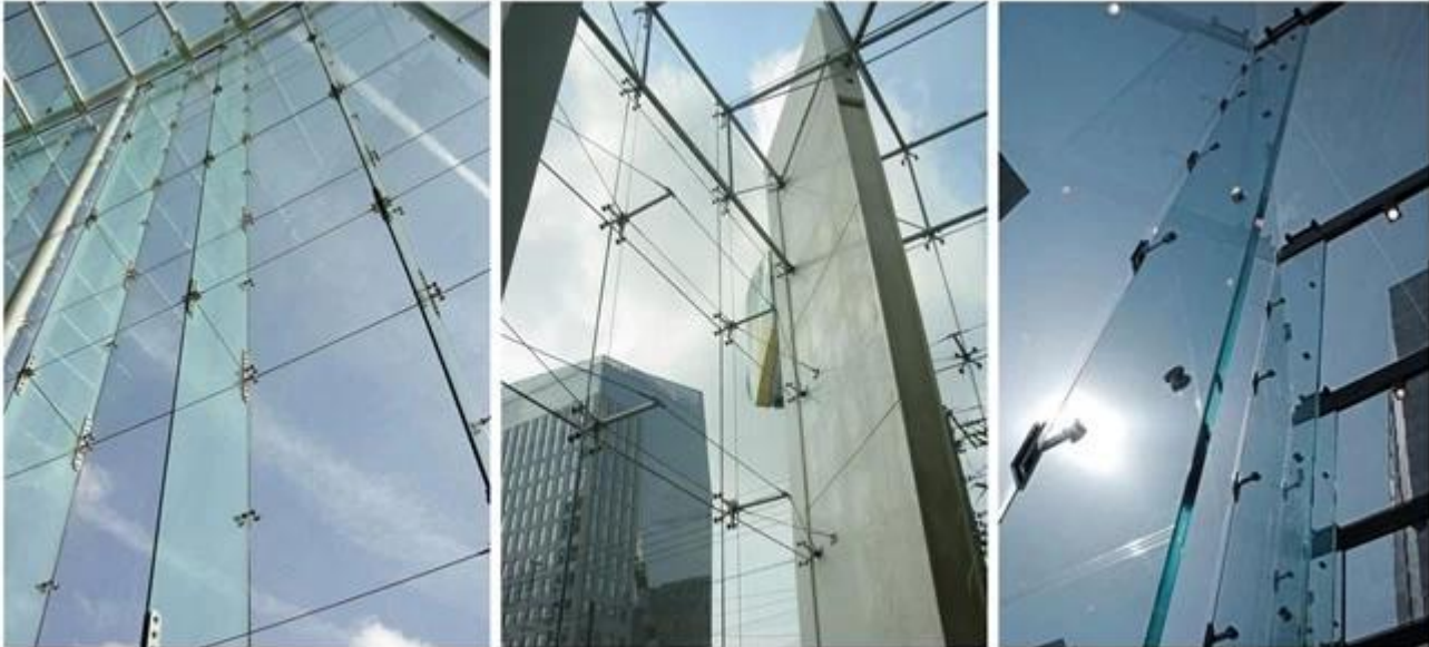
Jumbo-Größe Glastrennwand Flossen