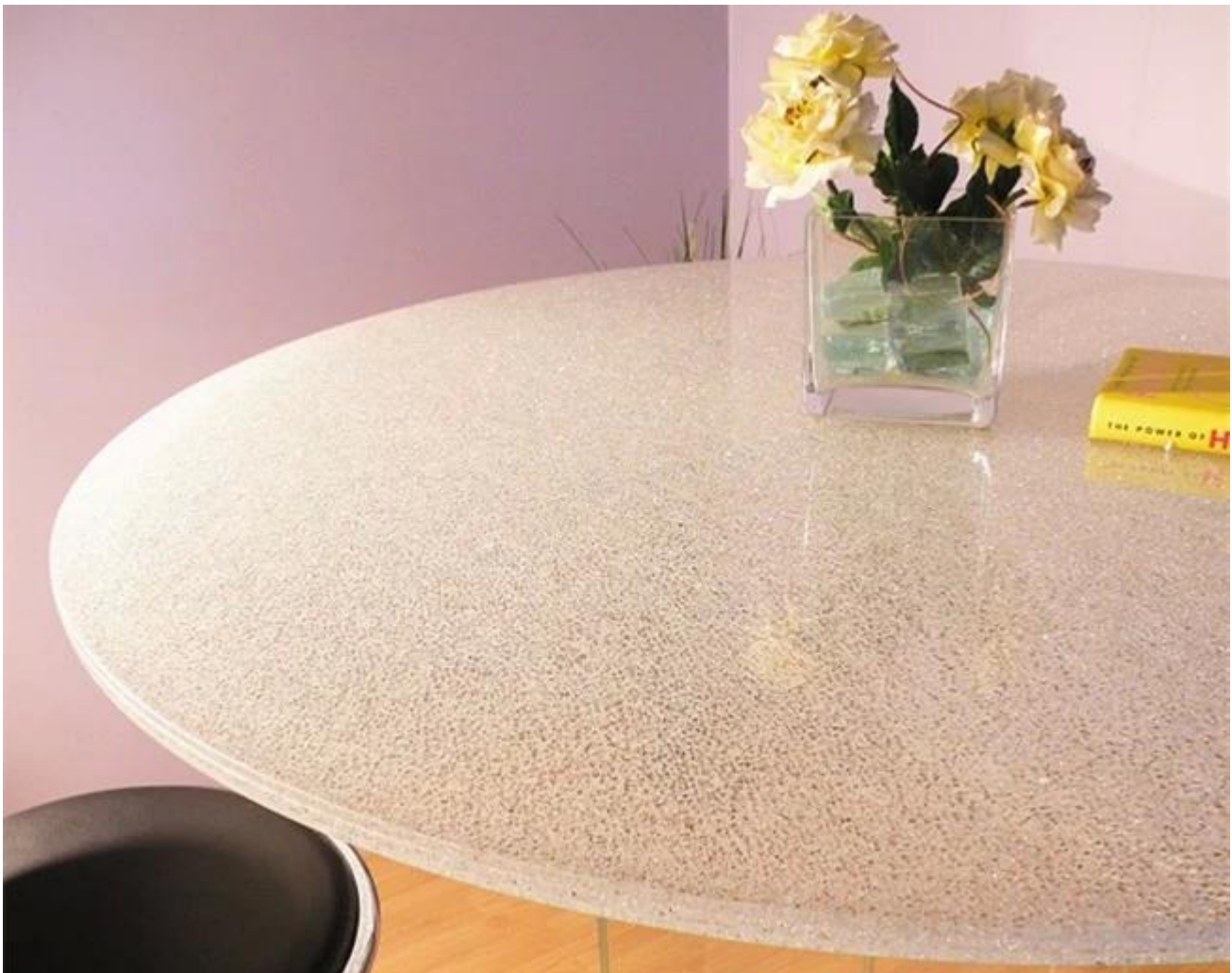
Klare Risse led gehärtetem Glas Tischplatten: