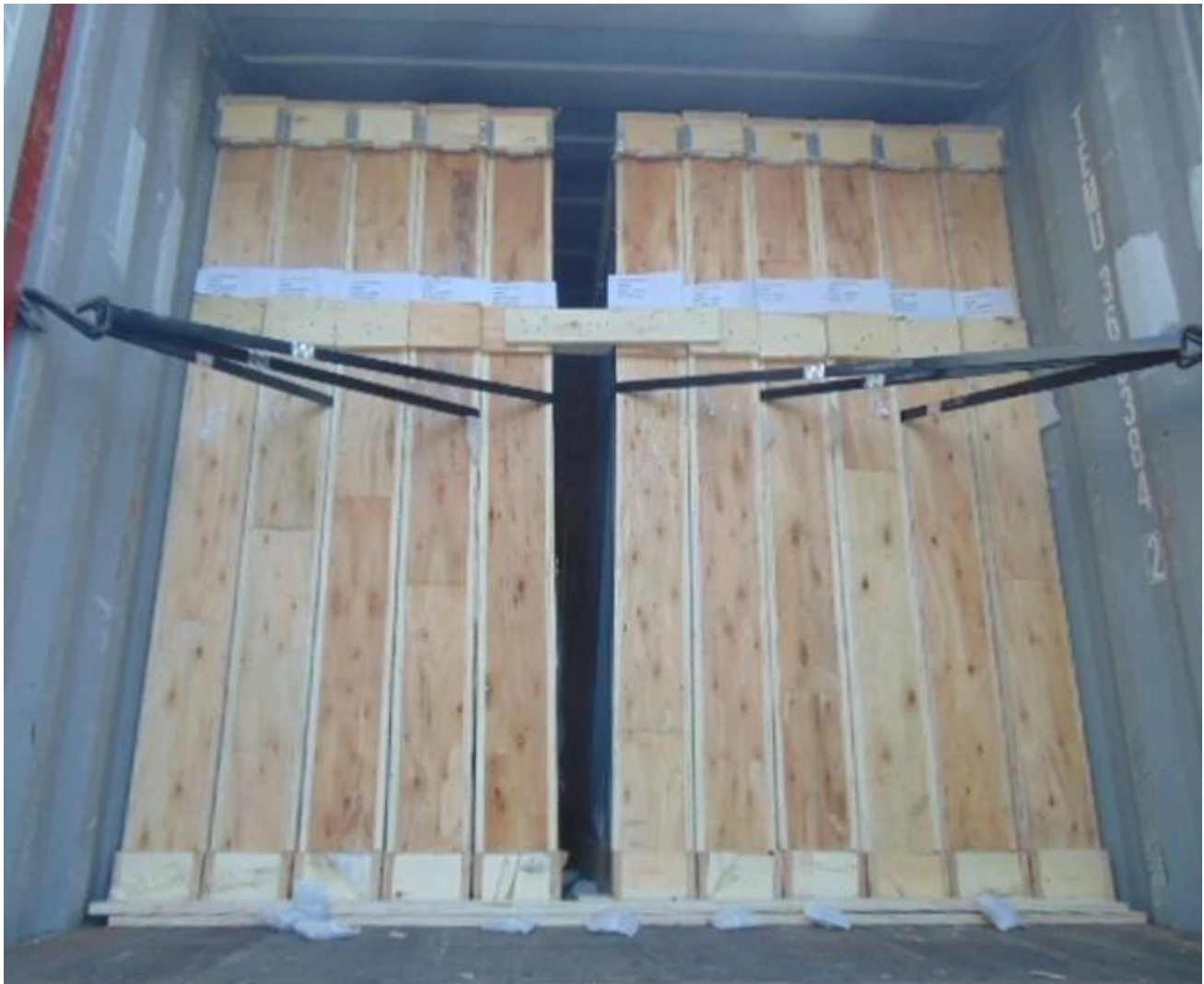
5MM eisenarme Float-Glas für Gewächshaus