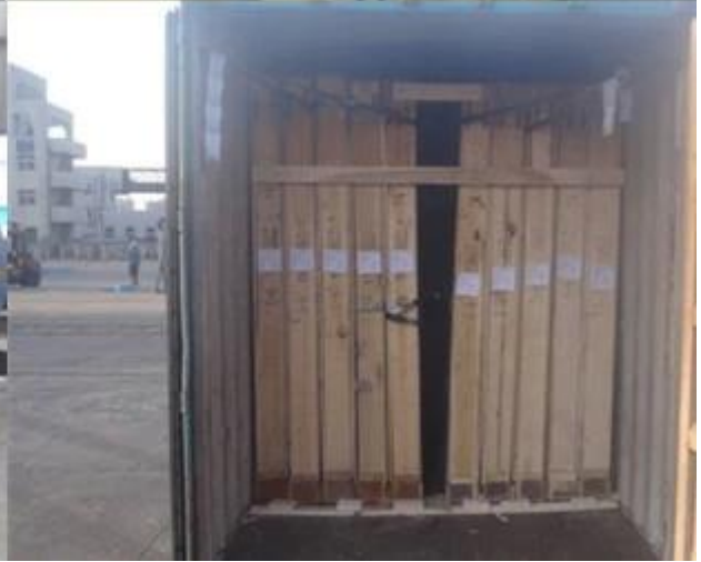
Anwendungen von 8,38mm Bronze laminierten Floatglas