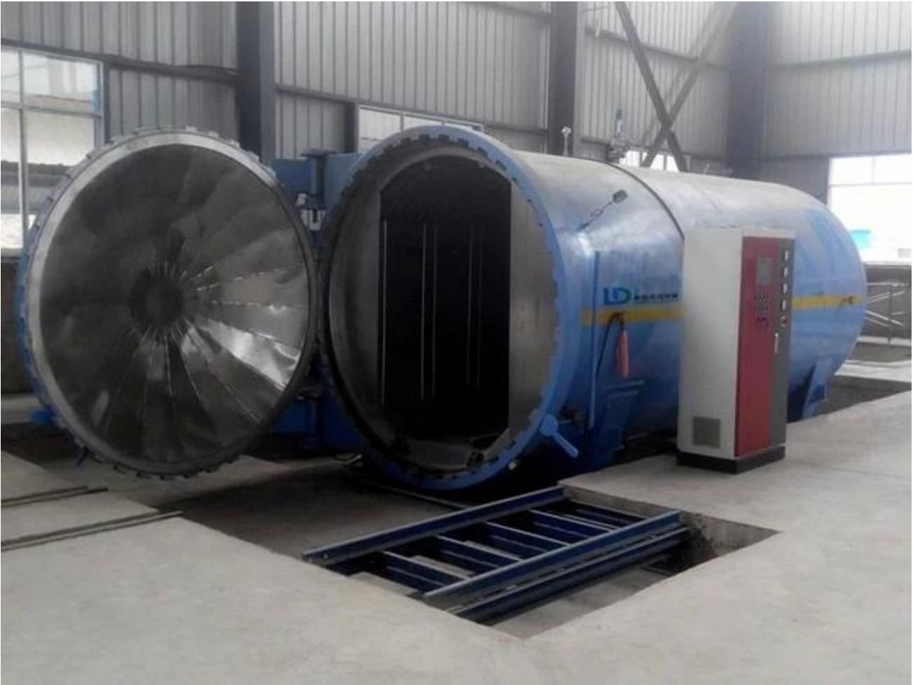
Gehärtetes Verbundglas Sicherheitsverpackung