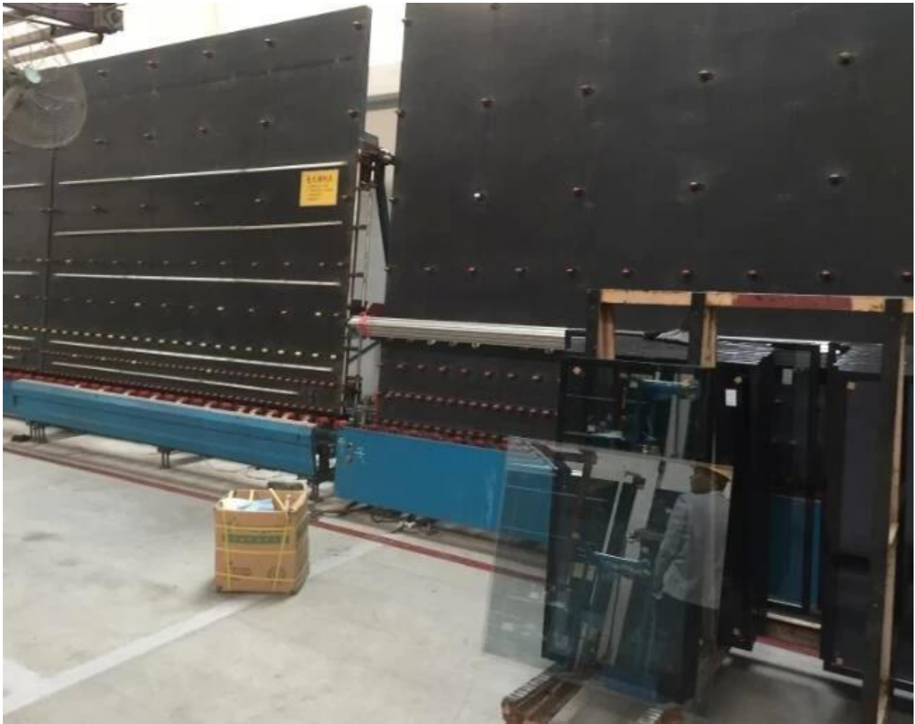
Verpackung und Beladung von Jimmy Glass