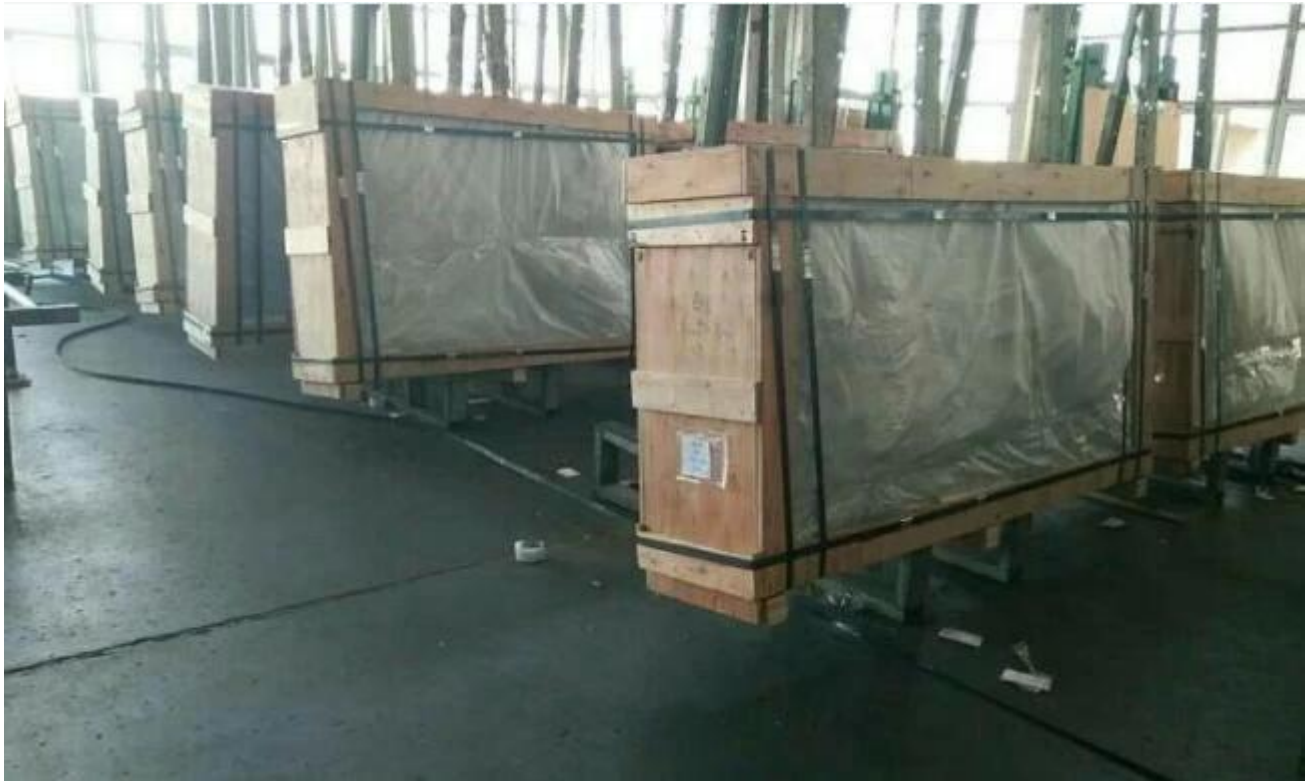
Beladung des Containers durch Jimy Glass Factory