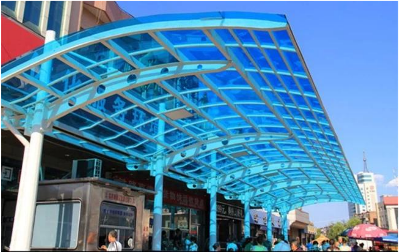
17,52 mm grün gefärbt temperiert lamelliertes Glas Balkone