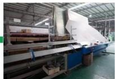
Aluminum frame folding machine