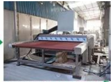
Glass cleaning and drying machine