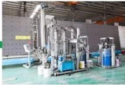
Injected sealant machine