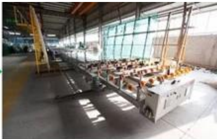
Glass cutting machine