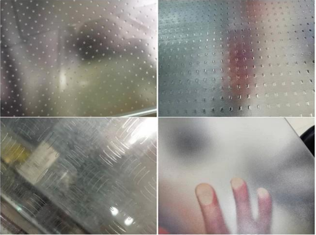
عرض 48 مم من الأحواض النقية ذات الأحماض النحاسية المغطاة بالحامض