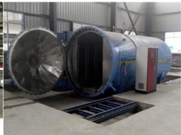
خفف من الزجاج مغلفة سلامة التعبئة والتحميل