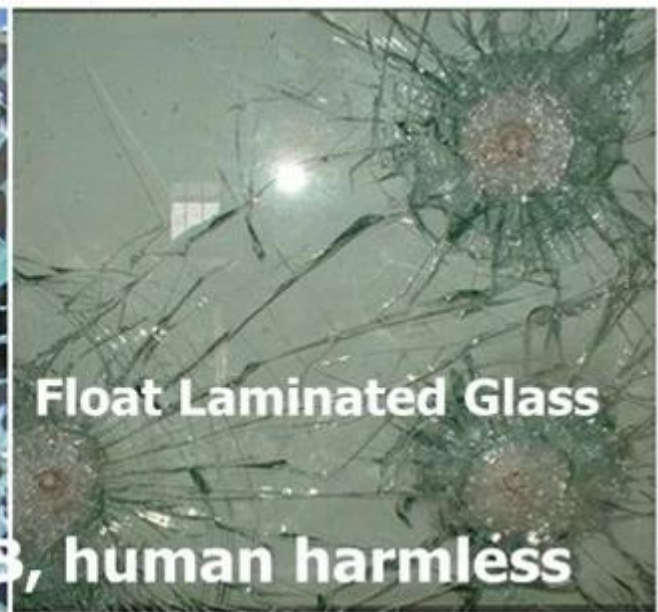
خفف من مصنع لإنتاج الزجاج مغلفة